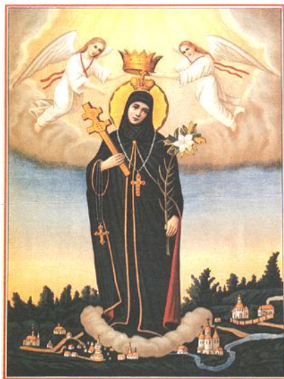
Св. преподобная Евфросиния Полоцкая.

Преподобная Евфросиния, игумения Полоцкая, в миру Предслава. дочь князя Георгия Всеславича. С детских лет она отличалась любовью к молитве и книжному учению. Отвергнув предложения о браке, Предслава приняла постриг с именем Евфросиния. По благословию Полоцкого епископа Илии, она стала жить при Софийском соборе, где занималась переписыванием книг. Около 1128 года епископ Илия поручил преподобной устроить женский монастырь. Отправляясь в Сельцо, - место будущей обители, - подвижница взяла только святые книги - "все свое имение". В новоустроенном Спасо-Преображенском монастыре святая обучала девушек переписыванию книг, пению, шитью и иным ремеслам. В 1161 году ее усердием был построен собор, сохранившийся до нашего времени. Преподобная Евфросиния основала также Богородицкий мужской монастырь, в который по ее просьбе Константинопольский Патриарх Лука послал список с чудотворной